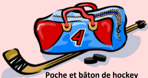
Poche et bâton de hockey