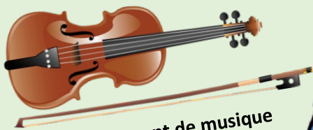
Petit instrument de musique