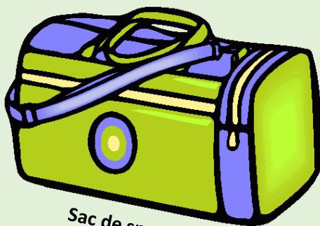
Sac de sport