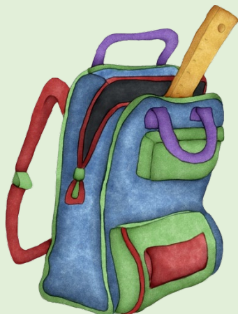
Sac à dos