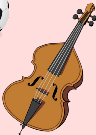
Gros instrument de musique

* Objets qui ne sont pas dans un sac fermé.