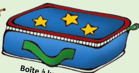
Boîte à lunch